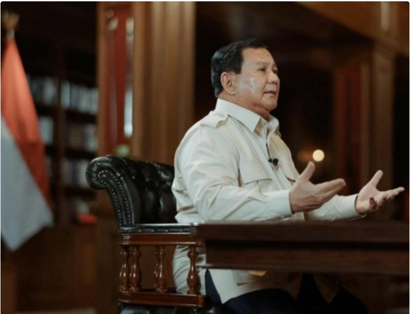
Prabowo Subianto Presiden RI 2024-2029

PENDIDIKAN - Indonesia dikenal sebagai negara yang kaya akan sumber daya alam. Dari hasil tambang yang berlimpah, laut yang luas dengan kekayaan hayati yang melimpah, hutan yang menjadi paru-paru dunia, hingga sumber daya energi yang tersebar di berbagai wilayah, semuanya menjadi kekuatan besar bagi